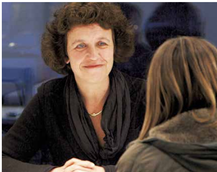
Jeugdarts in gesprek met een leerling